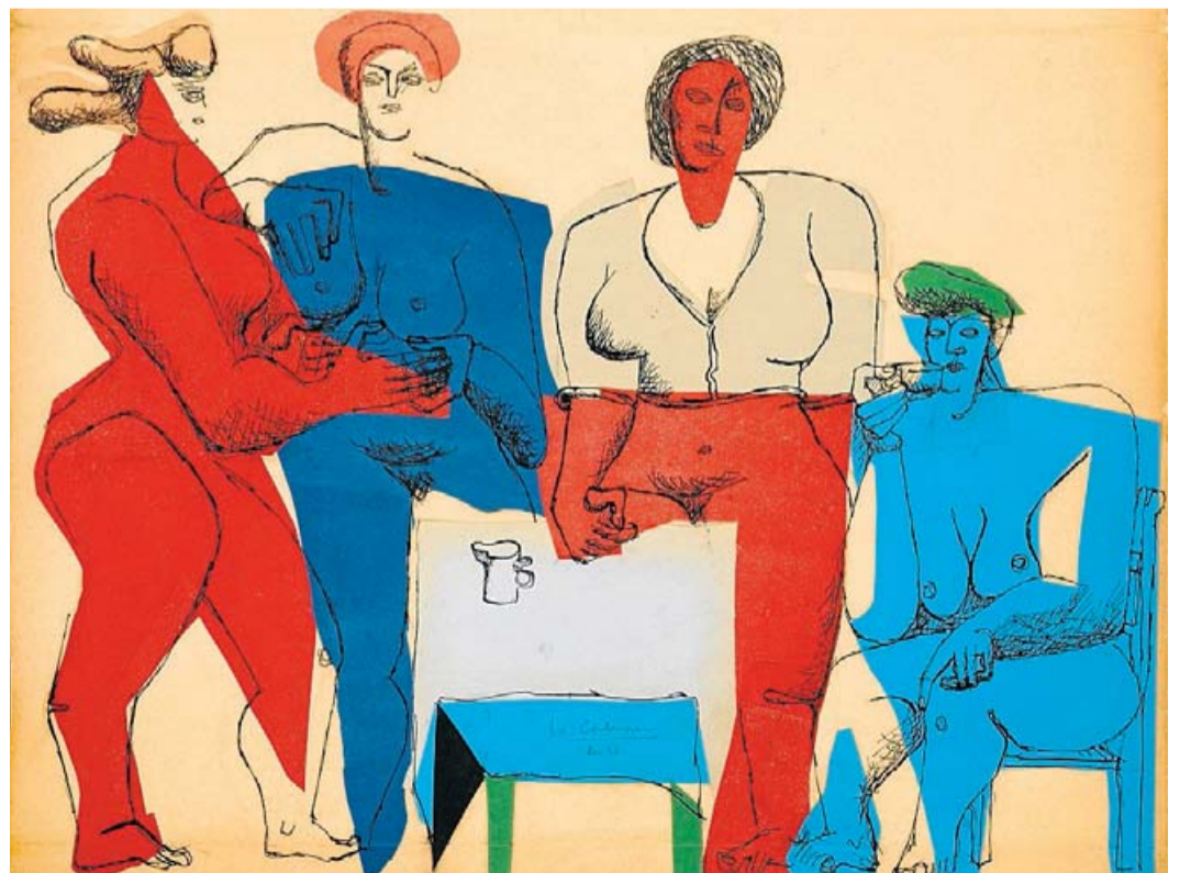
Quatre dones al voltant d'una taula, de Le Corbusier.