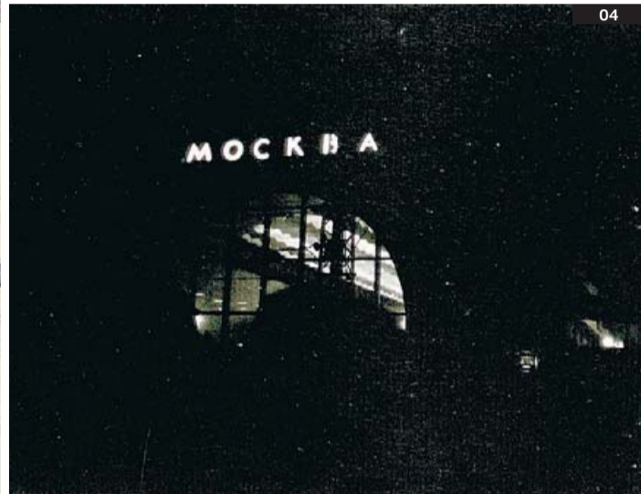
01. La Sagrada Ortodoxa Família , de Juli Capella. 02. Fragment Brusi , de Silvia Martínez Palou. 03. Kama House , dels RCR. 04. Mockba , una fotografia de Fernando Marzá. ARQUITECTES PER L'ARQUITECTURA