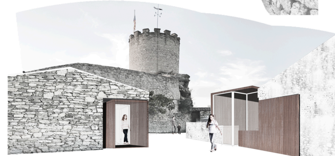
ERA + BOTIGA + SORTIDA SALA POLIVALENT

Mura Ermita de Sta Magdalena Rocafort Casa de les 7 tines El Pont de Vilomara